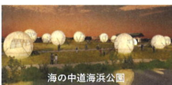
海の中道海浜公園