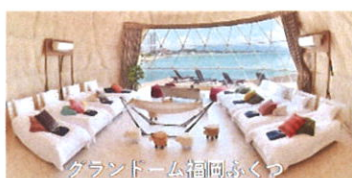
グラントーム福岡ふくっ